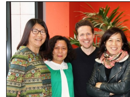
Yan Sonst 高雁 Schulorganisation